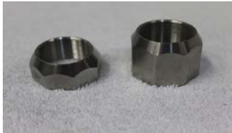
hohe und extrahohe Steuerkopfmutter