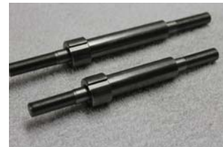
VR + HR Achse